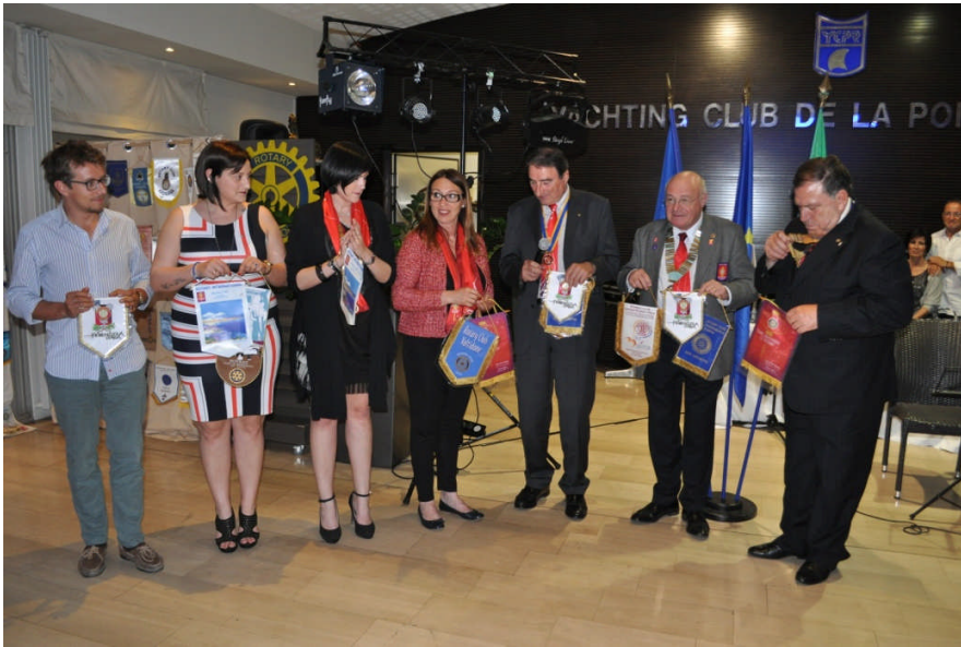
Echange des fanions